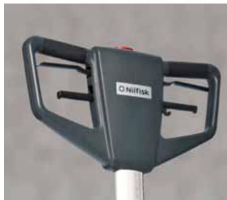
Une poignée et un timon ergonomique pour plus de confort d'utilisation et de productivité