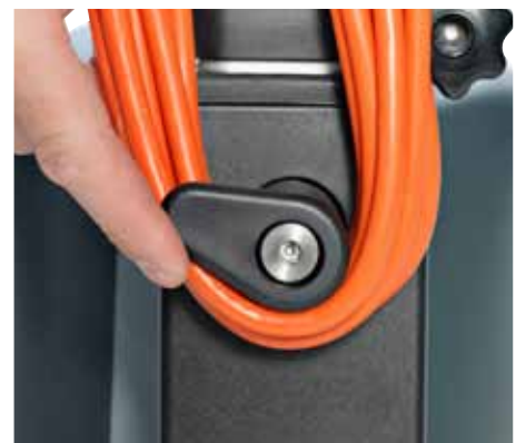
Crochet rotatif pour plus de simplicité