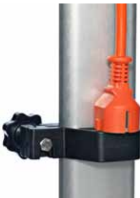
Support pour prise